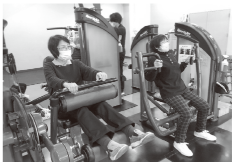
筋力トレーニング