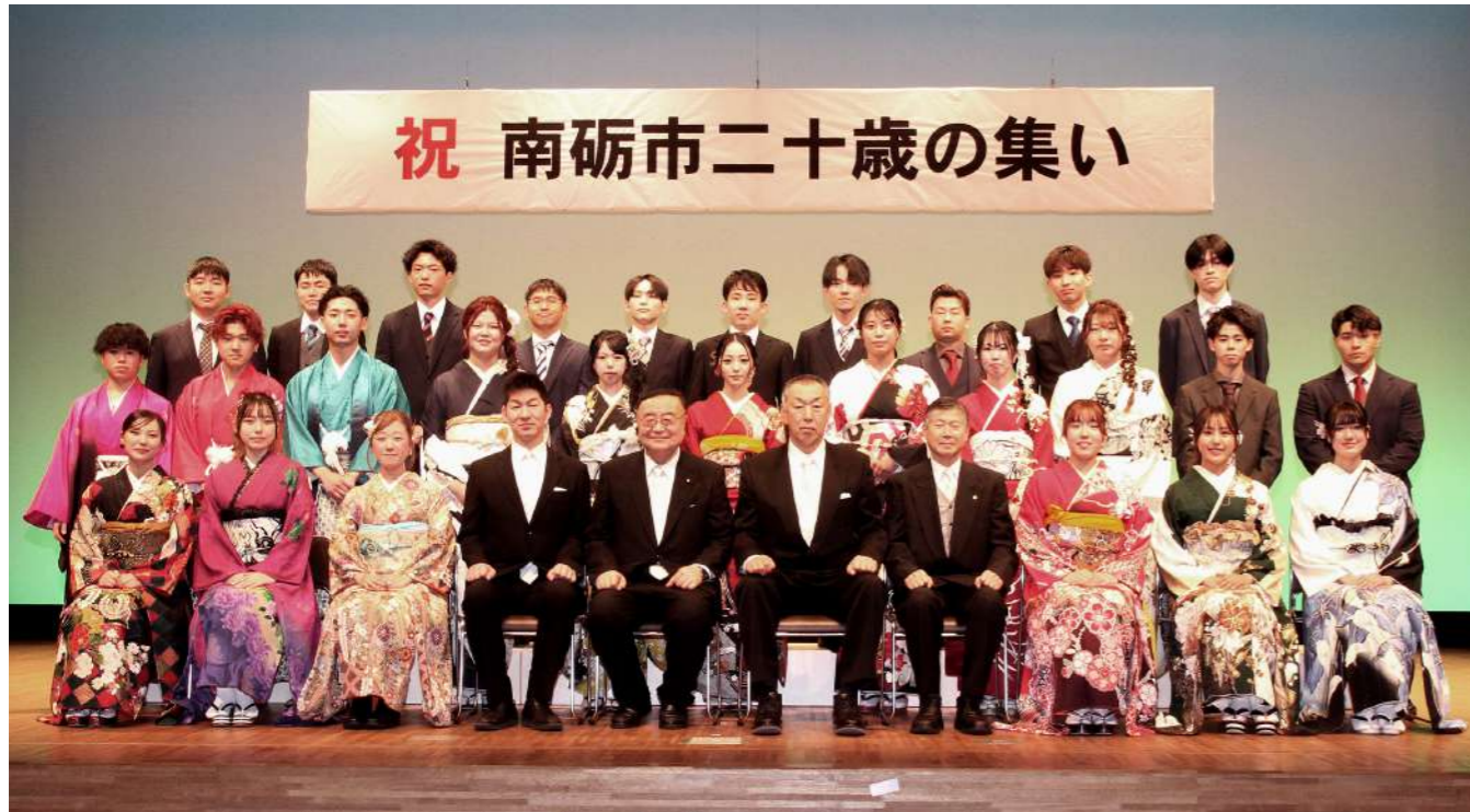
二十歳の集い 令和8年1月11日：ミントウ井波文化ホール（南砺市井波総合文化センター）

二十歳の集いを終えて、私は「大人になる」とは、ただ年齢を重ねることではなく、自分の選択に責任を持ち、周囲への感謝を忘れずに生きていくことなのだと感じました。これまで支えてくださった家族や先生、友人への感謝の気持ちを大切にしながら、これからの人生を自分らしく前向きに歩きたいと思っています。