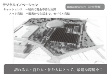
訪れる人・営む人・住む人にとって、最適な環境を！

5. 協議会の取り組み(住む人・営む人・訪れる人) 住民自治の立場から、地域に住む市民「住む人」と地域でお店やサービスを提供している「営む人」を軸に、地域課題の解決を「伝統とデジタルの融合」という戦略で解決できないか提案させていただきました。