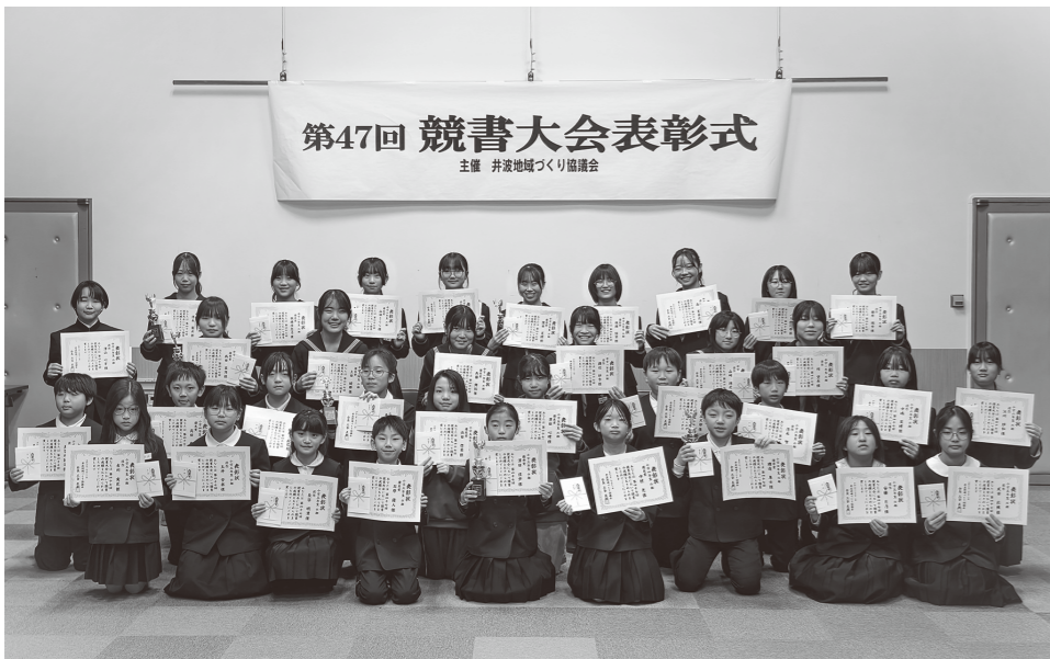
受賞された生徒の皆さん

ミントウ井波文化ホール(南砺市井波総合文化センター)で、井波小学校、井波中学校のご協力を得て、競書大会の表彰式を行いました。本年は326名の応募がありました。入賞された皆さん、おめでとうございます。